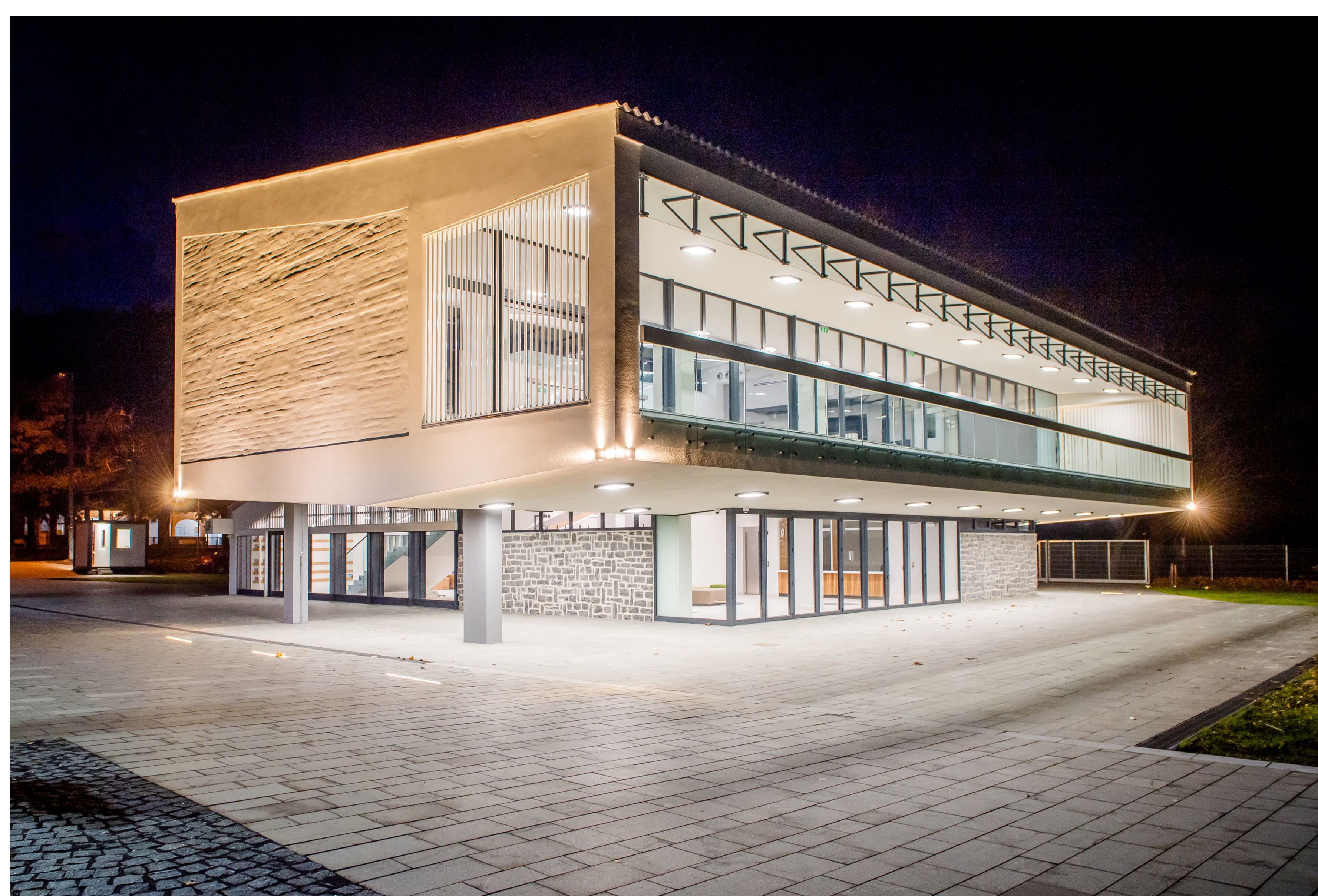
Műemlékvédett Tátika étterem (1962), ma információs iroda, közösségi tér és étterem, Badacsonytomaj, 2024

Nyugdíjasként is fáradhatatlanul tevékenykedett, helytörténeti kérdésekben számos javaslattal és információval segítette a fiatalabb generáció kutatóit és haláláig figyelemmel kísérte a helyi közélet eseményeit. Aktív építész mérnöki munkássága számtalan kiemelt alkotást eredményezett országwide. Apüspökladányi víztornyot a MEZŐTERV-ben még fiatal, kezdő építészként tervezte, majd, már Ybl-díjasként folytathatta építészeti tevékenységét. Főbb épületei: Miskolc – Avas lakópark, Budapest – Amerikai Iskola, Osztrák-Magyar Európaiskola rekonstrukciója, illet-