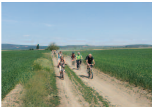
Az autópálya után (a háttérben fehérlik a felüljáró)