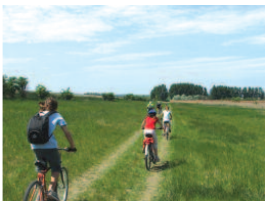
célegyenesben, jobbra a tó körüli fák