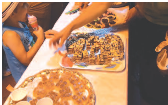
... és a kóstolás.