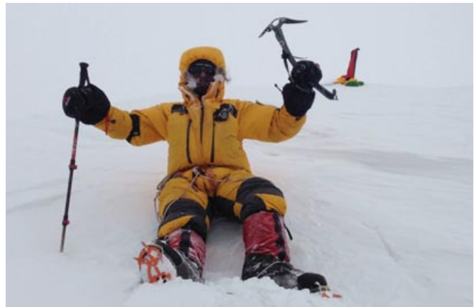
Annappurna csúcs – első magyar a csúcson

K.D.: A hegyen két folyamat játszódik le: állóképességünk az első napon a legjobb, az utolsón pedig a legrosszabb. Az akklimatizációs folyamat ennek az ellenkezője. Amikor a csúcsmászásra készülünk, azt a pillanatot – pár napot – igyekszünk elcsípni,