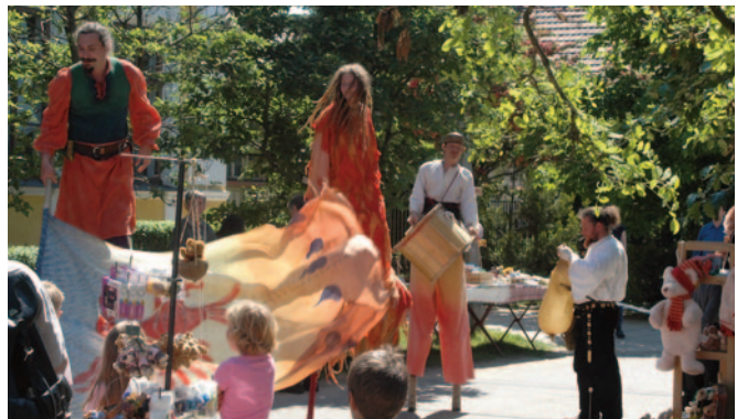
Gólyalábas vidámkodás a gyerekekkel